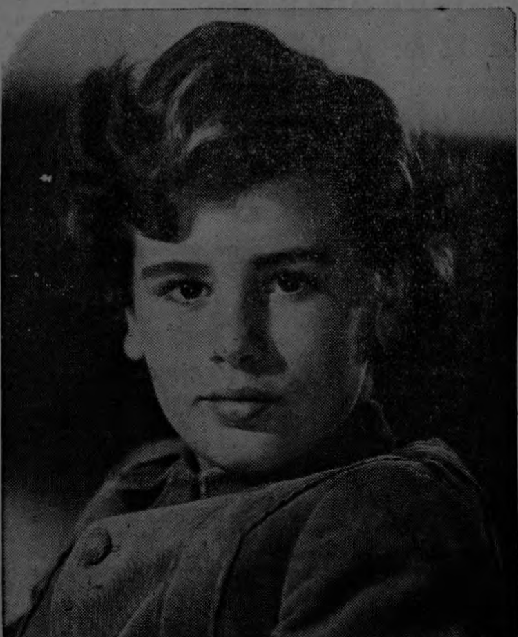
Astro juvenil, DEAN STOCKWELL de la Metro Goldwyn Mayer pertenece a la Asociación de Jóvenes Exploradores.

Dean Stockwell ha logrado finalmente que su ciudad natal conozca sus méritos. Aunque vivió la primera en Hollywood, el ac-