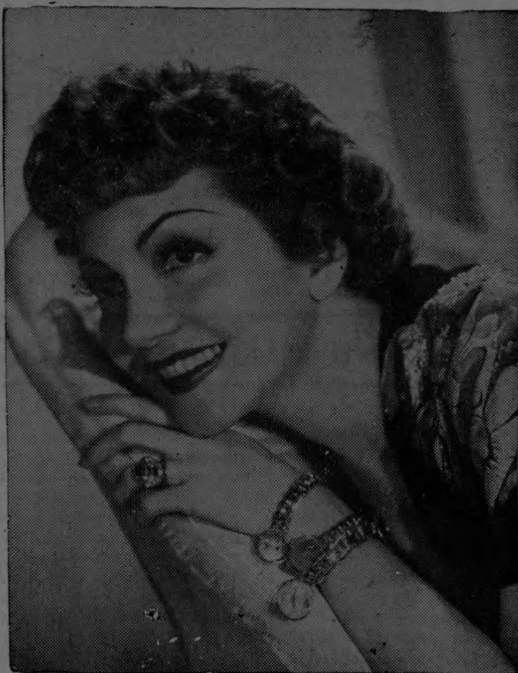
Nunca verá usted reflejada en la cara de la adorable CLAUDETTE COLBERT, estrella de Universal-Internacional, la expresión de tormento que se refleja cuando los zapatos aprietan o no sientan bien hace notar el experto de Hollywood Max Factor Jr.

No lleve con demasiada frecuencia zapatos de suela elevada; son decididamente de carácter exótico y nunca sientan bien con ves-