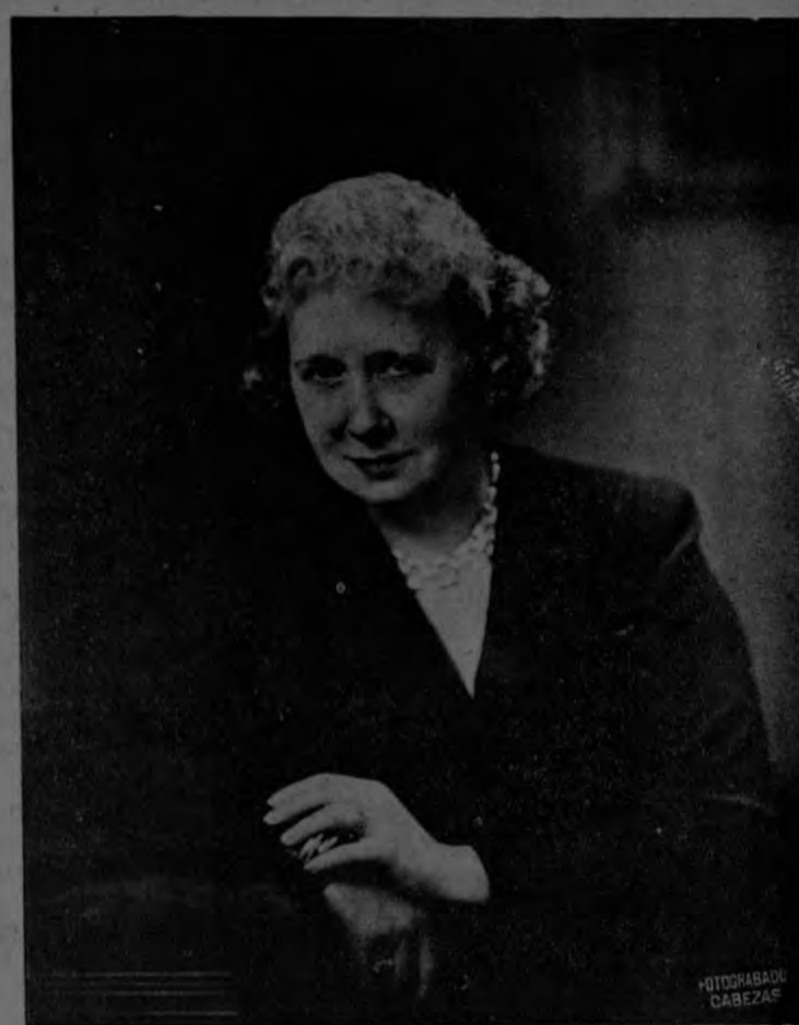
Señora Bess Wallace Truman

Nuestro saludo a la Primera Dama en la fecha de la Independencia de EE. UU.